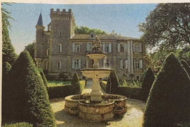
PHOTO CHÂTEAU CAPION

Une première: le château Capion à Aniane invente "la brocante bis-tronomique". Une manifestation qui se déroule samedi 23 dans un cadre enchanteur, en trois volets.