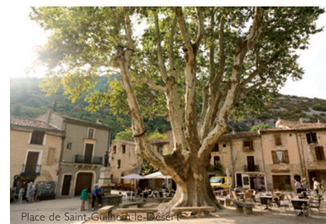
Place de Saint-Guilhem-le-Désert