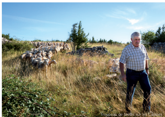
Troupeau de brebis sur les Causses