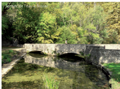
Sentier de l'eau à Brissac