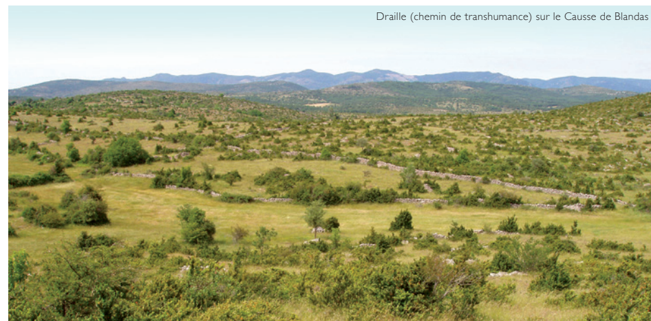
Draille (chemin de transhumance) sur le Causse de Blandas