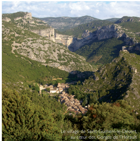
Le village de Saint-Guilhem-le-Désert, au cœur des Gorges de l'Hérault