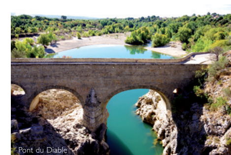
Pont du Diable