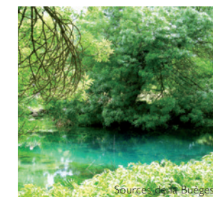
Sources de la Buèges