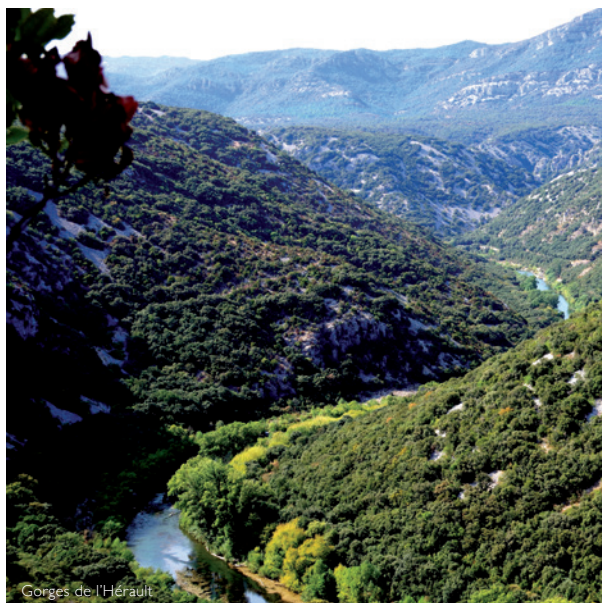
Gorges de l'Hérault