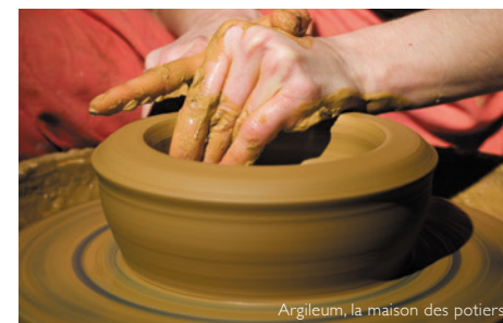
Argileum, la maison des potiers