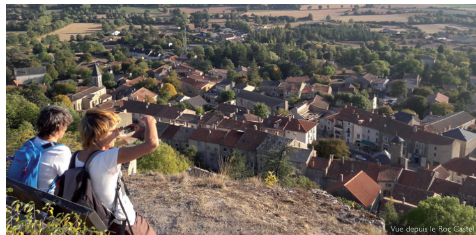
Vue depuis le Roc Castel