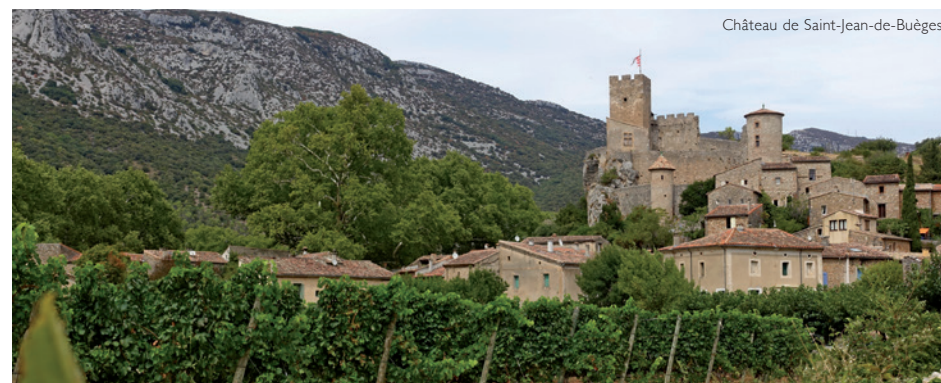
Château de Saint-Jean-de-Buèges

Au pied des falaises de la Séranne, Brissac est un îlot de verdure au milieu de la garrigue. Un troupeau de moutons installés au cœur du village nous regarde passer à travers les jolies ruelles jusqu'au surprenant château perché sur sa butte, témoignage d'un passé médiéval. Après quelques courses à l'incontournable épicerie-café-restaurant l'Arbousède*, nous entamons la marche vers la discrète vallée de la Buèges , un affluent de l'Hérault jalonné de barrages, ponts, moulins et canaux d'irrigation. La montée est rude tandis que nous profitons du spectacle de la végétation méditerranéenne et des parapentistes survolant la Séranne et Notre-Dame-de-Suc 1 . Au village de Saint-André-de-Buèges , nous prenons un café