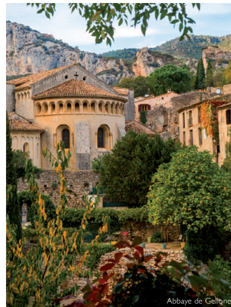
Abbaye de Gellone