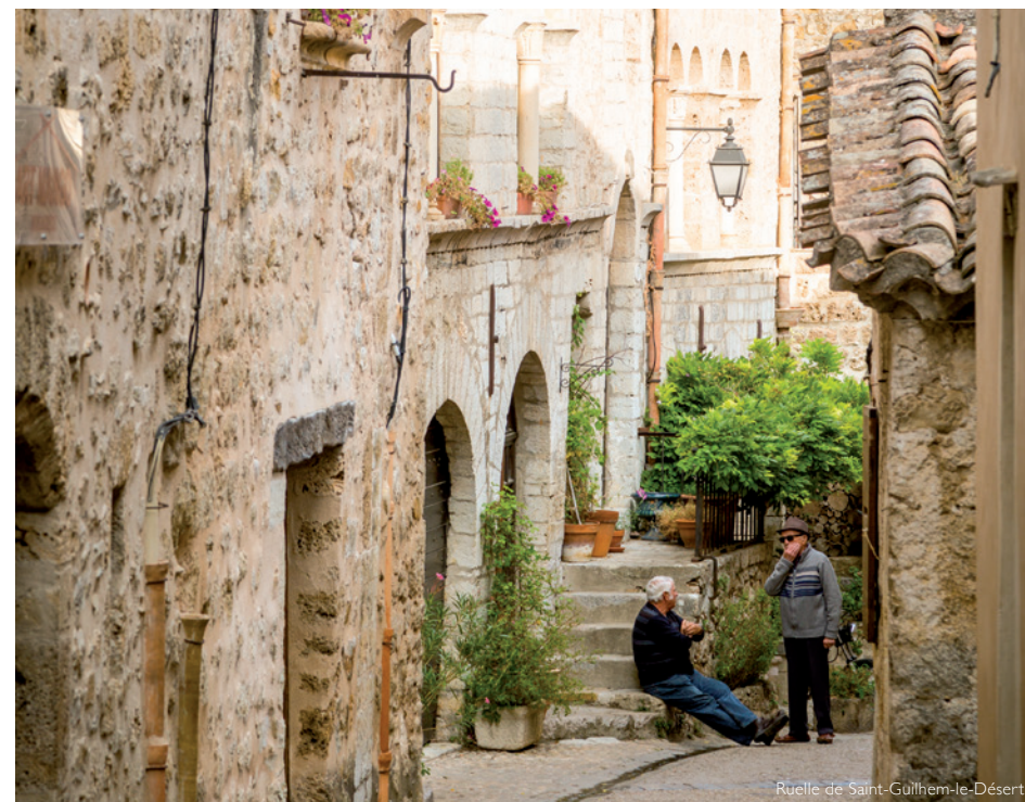
Ruelle de Saint-Guilhem-le-Désert

la tête pleine d'images de ce séjour singulier; entre paysages agricoles, villages cachés, causses arides et gorges verdoyantes.