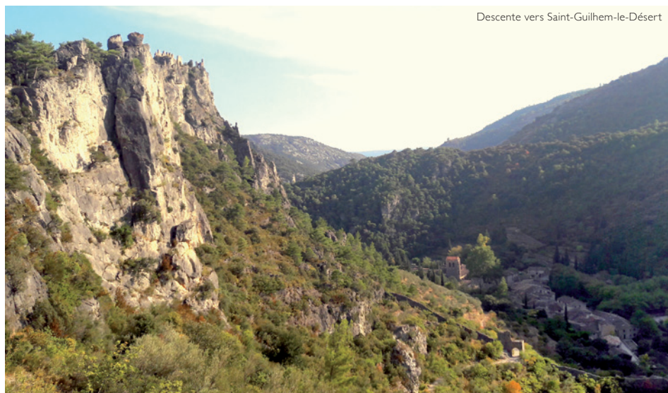
Descente vers Saint-Guilhem-le-Désert

Nous prenons la route ce matin jusqu'aux sources de la Buèges où une eau limpide jaillit dans un parc ombragé. De là, le sentier muletier nous mène jusqu'à Pégairolles-de-Buèges , en passant par le magnifique hameau du Méjanel encore pavé et bordé de murets en pierres sèches. Puis nous nous perdons dans le dédale des ruelles en calade du charmant village de Pégairolles.