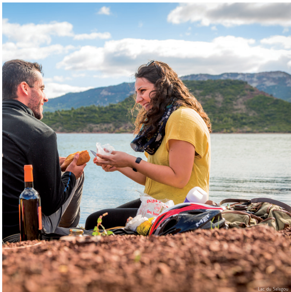
Lac du Salagou