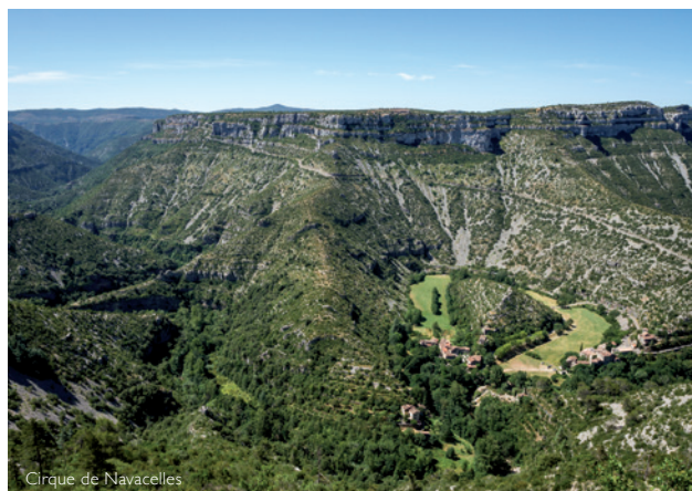
Cirque de Navacelles