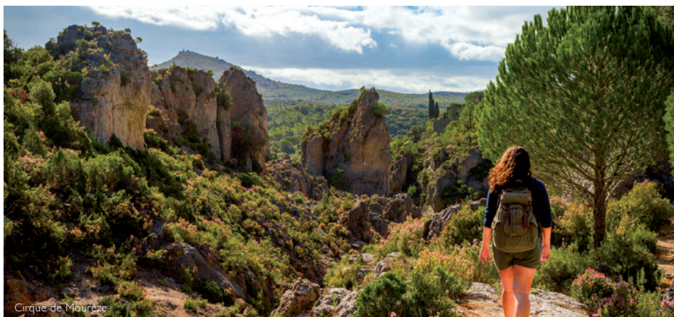
Cirque de Mourèze