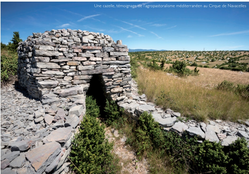
Une cazelle, témoignage de l'agropastoralisme méditerranéen au Cirque de Navacelles