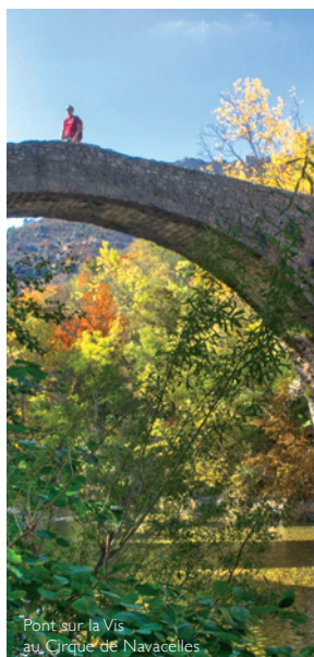
Pont sur la Vis au Cirque de Navacelles

UN PROJET DU RÉSEAU DES GRANDS SITES DE FRANCE