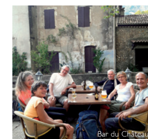
Bar du Château

1. La chapelle romane et le Pont de Saint-Etienne d'Issensac, situés au sud de Brissac valent le détour.